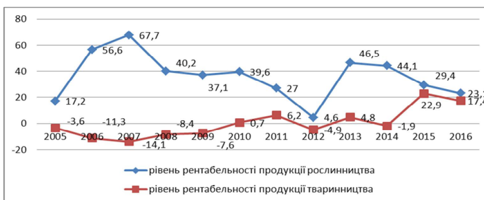
Рис. 3. Динаміка рівня рентабельності виробництва сільськогосподарської продукції, %.*

*За даними Головного управління статистики у Львівській області (2018).