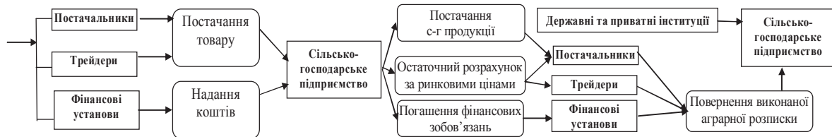
Рис. 1. Етапи здійснення позикових операцій з використанням аграрних розписок.*