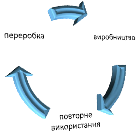
Рис. 2. Схематичне зображення кругової економіки.

2018). На сьогодні існує понад десять візуалізацій моделі кругової економіки, при цьому всі вони володіють схожою структурою. Однак найбільш поширеною і повною за змістом моделлю є модель кругової економіки, заснована на розробках Фонду МакАртура, яка представлена на рис. 2.