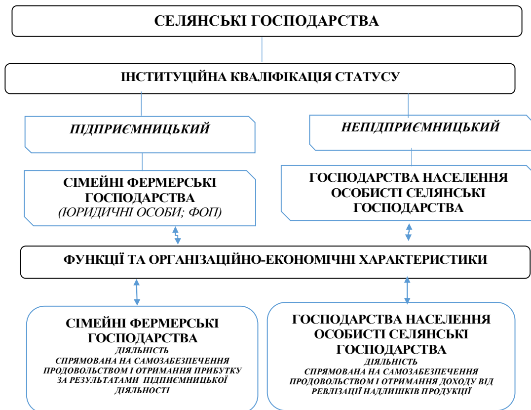
Рис. 1. Організаційно-інституційна структура селянських господарств сімейного типу в аграрному секторі економіки України*

лася їхня виключна інституційна роль у формуванні продовольчої безпеки на місцевому рівні – рівні громад. Наявна проєкція цієї спроможності через систему родинних зв'язків (інститут сім'ї) на членів суспільства, які проживають у містах. Вважаємо, що селянські господарства також є провідниками зайнятості, спроможностей продовольчого забезпечення, отримання доходів, а також відбудови територій села, збереження його як середовища життя та господарювання.