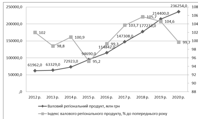
Рис. 1. Динаміка валового регіонального продукту*

*Побудовано автором за даними Головного управління статистики у Львівській області