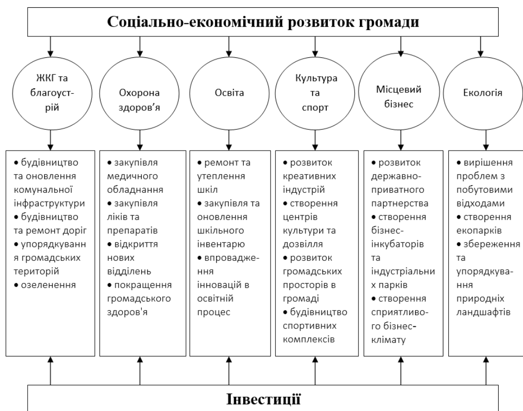
Рис. 1. Схематичне зображення взаємозв'язку інвестиційного забезпечення з економічним розвитком громад

Внутрішні інвестиційні ресурси громади – це передусім власні надходження від податків і зборів до місцевого бюджету, які органи місцевого самоврядування можуть спрямовувати на розвиток (Борщ, 2017, с. 47). Ідеться про так званий бюджет розвитку – частка коштів місцевого бюджету, що спрямовується на купівлю, оновлення основних засобів та інших матеріальних і нематеріальних активів, які перебувають на балансі бюджетних установ громади. Видатки розвитку не є однаковими у всіх громадах, оскільки залежать від низки різноманітних чинників, як-от розмір громади, чисельність населення, кількість підприємств тощо. До прикладу, можна проаналізувати внутрішні інвестиційні ресурси місцевого бюджету Ямницької сільської ради, яка є органом місцевого самоврядування Ямницької територіальної громади Івано-Франківської області (табл.).