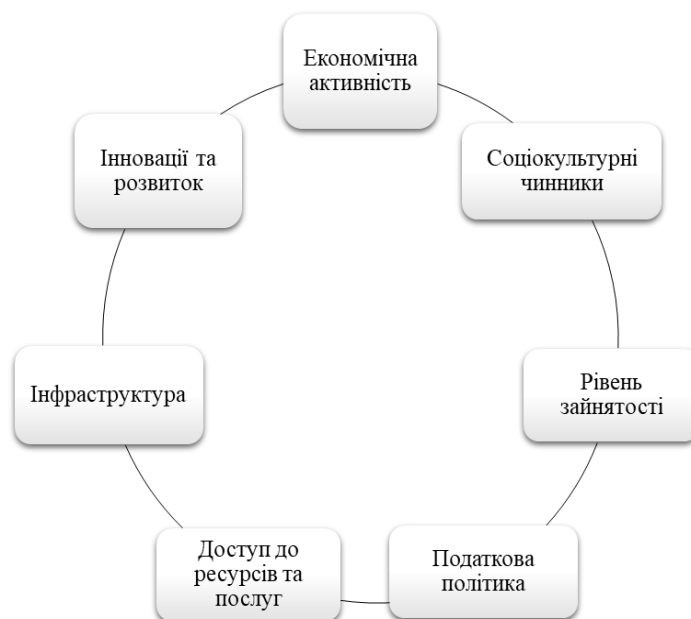
Рис. 1. Фактори економічного середовища територіальних громад *Розроблено авторами

2. Інфраструктура (розвинута інфраструктура, така як транспортна, енергетична, освітня та медична, важлива для стабільності територіальних громад; сформована інфраструктура може забезпечити легший доступ до ресурсів та ринків).